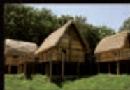
Museo delle Palafitte del Lago di Ledro