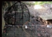
Centro Preistorico Marcesina Grigno