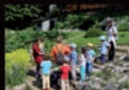
Giardino Botanico Alpino Vioite