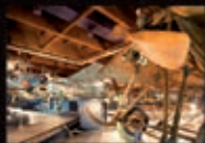
Museo dell'Aeronautica Gianni Caproni

In ogni periodo dell'anno tante occasioni per trascorrere ore liete tra natura, scienza e gioco. Mostre, animazioni, osservazioni del cielo, laboratori creativi, percorsi educativi, escursioni naturalistiche e suggestivi appuntamenti tra scienza e arte. La sede centrale di Trento è capofila di una rete che comprende: