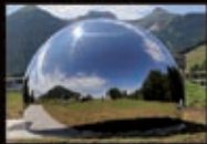
Osservatorio astronomico Terrazza delle Stelle