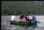
Stazione Limnologica del Lago di Tovel